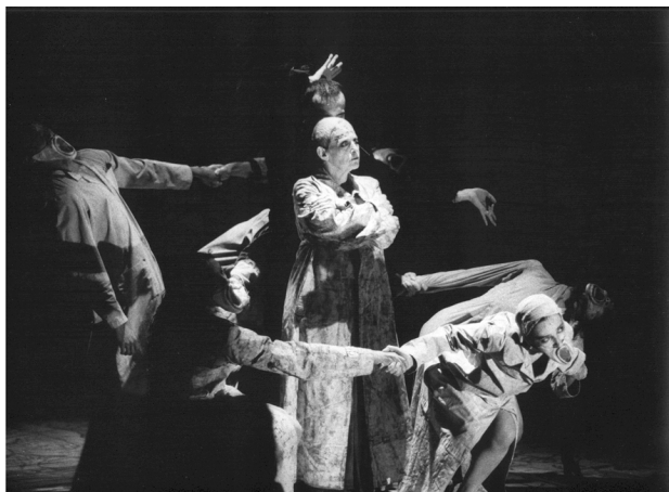
Una delle fotografie di Renzo Zuppiroli in mostra a Funo